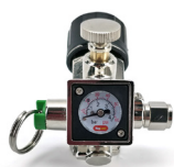
Mini 360 regulator