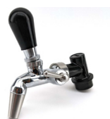
Tappekran med ball lock shank