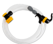
Tappeslange med ball lock og kran