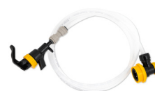
Piknik-kran med skumdempende slange