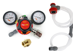
MK4 regulator inkl overgang til Sodastream